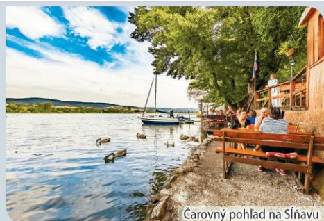
Čarovný pohľad na Sĺňavu

miakovú placku, bryndzové halušky či čapované nápoje, ktorých je tu široký výber, či len tak na terase pokochať sa a inšpirovať prírodou. U Dina sa žije v symbióze s prírodou – bez plastových obalov a odpadkov v okolí.