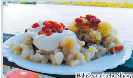
Halušky na brehu Sĺňavy

Letná terasa s výhľadom na hladinu jazera a panorámu Považského Inovca sa nachádza pri Lodenici v Piešťanoch, priamo na cyklotrase okolo Sĺňavy. Zákazníci sa radi zastavia na ze-