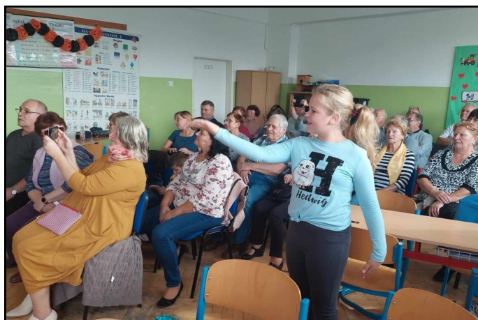
Deň starých rodičov v 5.B

V októbri, ktorý je Mesiacom úcty k starším, žiaci 5.B pozvali svojich starých rodičov na milé stretnutie. Pripravili si pre nich krátky kultúrny program v slovenskom, ale aj v anglickom ja-